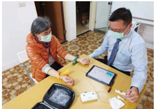
3/20(六)保健新學堂—自律神經檢測