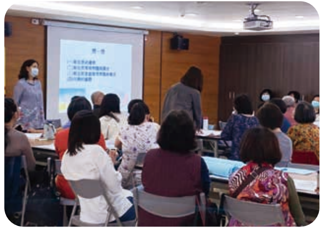
3/20執行長為中正區居家托育服務人員授課