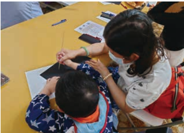
3/18(四)繪本屋—盲畫技巧練習

據點的活動多元且生活化，在增進知能的同時促進成員彼此間的交流。接下來將要進行展珍新的志願服務，需要招收志工幫忙活動的規劃及進行。歡迎對於多元文化交流活動支援服務有興趣的人與我們聯繫。