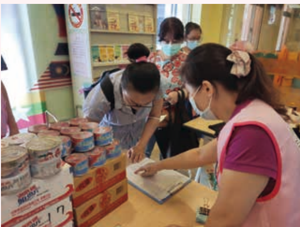
志工協助本會進行物資贈送的服務