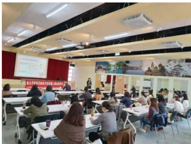
講師介紹新移民在臺概況

無論這些是資深或者資歷較淺的通譯人員，大家都是抱持著虛心的態度在學習，看著他們，我心裡除了有著滿滿的感動之外，更多是感恩的心，感謝這些通譯人員願意為了語言不通的新移民，盡一份心力提供服務與協助，讓來到臺灣生活的人們可以更快適應環境，並且感受到溫暖的家的感覺。