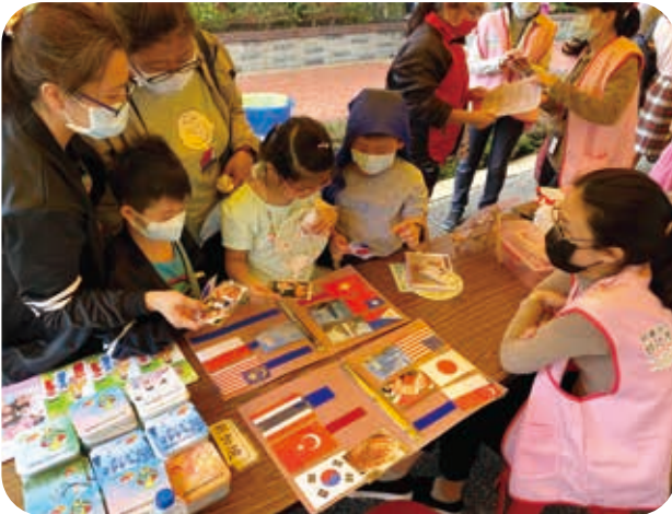
3/24參與「春暖花開 珍愛關懷」園遊會