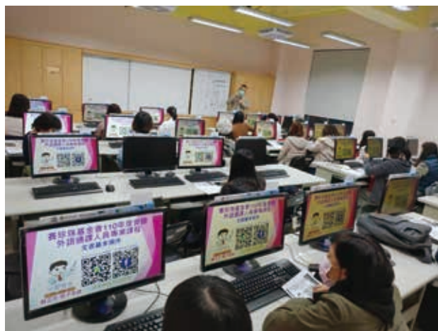
外語通譯培訓課程-文書基本操作