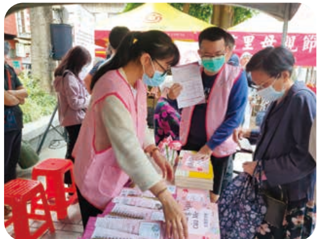
5/1本會於大安區光信里母親節活動擺攤宣導