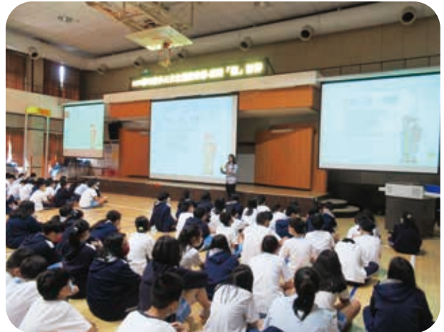
4/16介壽國中演講授課