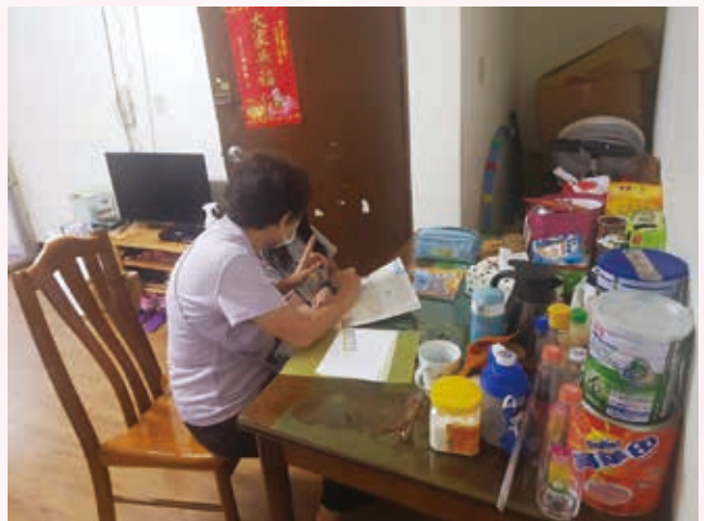
志工到府課輔的景況