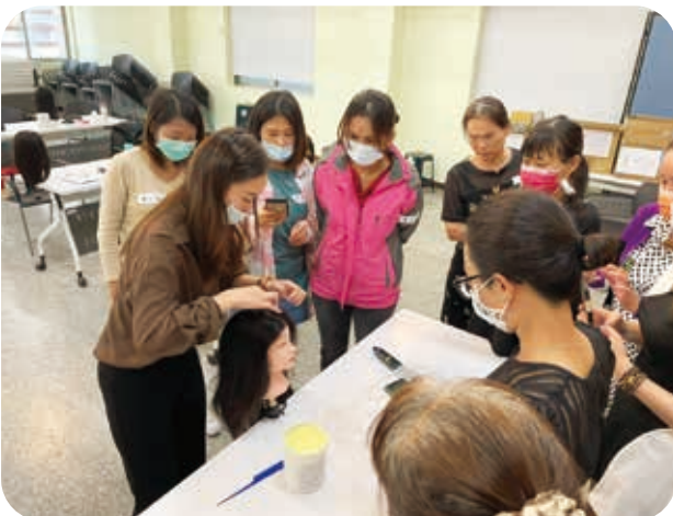
4/18愛的剪刀手基礎-美髮培力工作坊