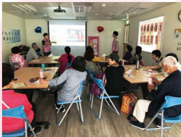
充電讚！系列講座的課程上課情形