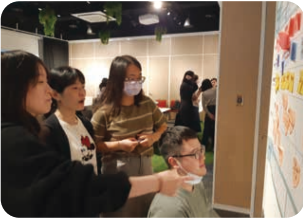
2/25本會同仁參加明怡基金會「服務者使用旅程圖」工作坊